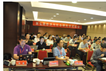
第七届经济与社会研究学术年会