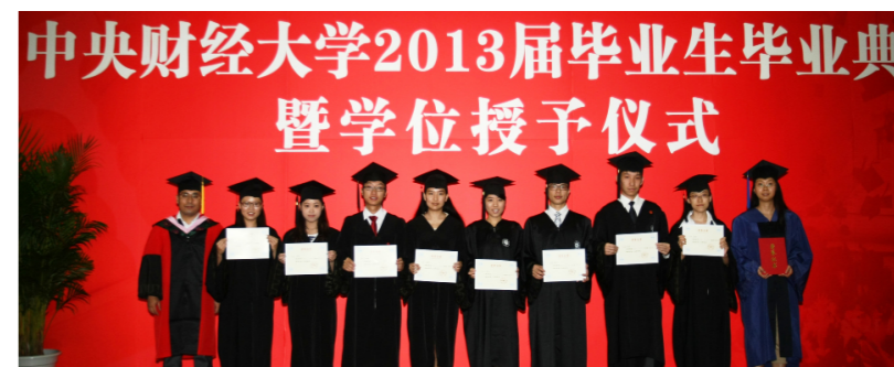
2013届毕业生毕业典礼

学院现有在校学生400余人，其中本科生近300人，研究生100余人。本科教育既体现专业的规范性和统一性，又有鲜明的“财经特色”，其中社会学专业以经济社会学为特色，应用心理学专业以经济心理学为主要方向，社会工作专业突出企业社会工作特色。