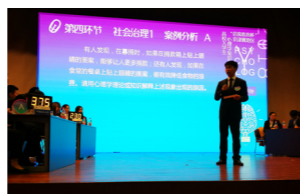
京津冀地区高校大学生心理学知识邀请赛

学科知识竞赛系列活动为全校乃至京津冀大学生打造了知识角逐的舞台，每年吸引无数优秀学生投身其中，尽显风采。中央财经大学礼仪大赛和首都高校心理学知识邀请赛，掀起了一股又一股学习热潮。