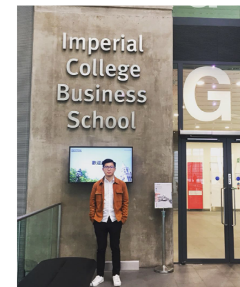
学生出国交换学习

学院积极开展对外交流与合作。除与国内兄弟高校、科研机构以及政府部门保持良好的交流与合作关系外，学院还与美国、荷兰、澳大利亚以及我国香港、台湾地区的高校建立了本科生与研究生联合培养、学分互认、师资交流、学术研究等合作机制。