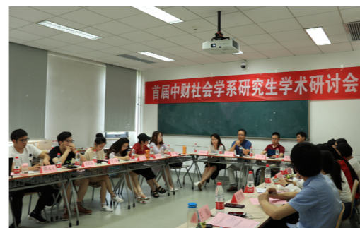
首届中财社会学系研究生学术研讨会

心理学学硕旨在培养能够敏锐洞察和系统探究基础心理学与应用心理学领域前沿学术问题，并将心理学的知识与方法用于理解和解决广泛的经济与社会问题的高级专业人才。