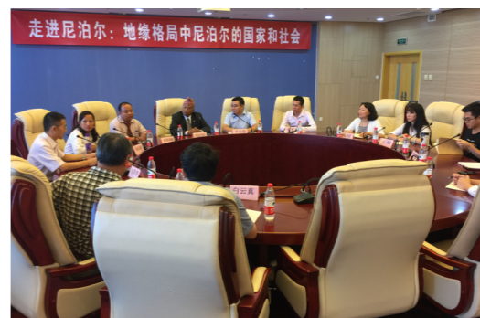
学院邀请尼泊尔共产党（联）高级领导人莅临学校并做讲座

学院通过“走出去，引进来”的方式大力开展国际交流与合作。十余年来，学院很多教师先后赴美国哈佛大学、斯坦福大学、芝加哥大学、杜克大学、卡内基梅隆大学、加州大学伯克利分校、加州大学戴维斯分校、密歇根大学、日本早稻田大学等世界著名大学访学交流，并与国（境）外研究者开展了研究合作与联合项目。同时，学院也邀请了哈佛大学、芝加哥大学、斯坦福大学、牛津大学、密歇根大学、普渡大学、纽约州立大学、加拿大温莎大学、澳大利亚墨尔本大学等国（境）外大学的知名教授短期讲学或举办讲座，并为本科生和研究生开设短期课程。