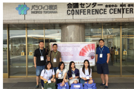
学院教师与硕士生赴日参加国际心理学大会

学院教师也广泛参与国际学术会议，扩大学术交流，提升学院声誉。教师赴美国、德国、日本、荷兰、韩国等国家（地区）参加学术会议累计近百人次，宣读或张贴100余篇论文或摘要。2007年，学院还牵头举办了“可持续发展与和谐社会构建”中美学术研讨会，邀请到了儒学思想家、哈佛大学杜维明教授等10位美国知名学者参会。