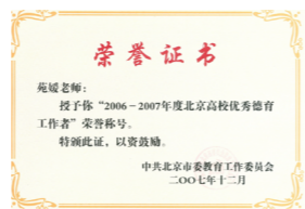
教师部分获奖证书