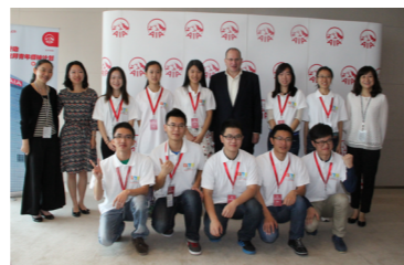
“爱心换客”团队获友邦青年计划优秀团队赴香港参会

读书会由指导教师带领，每学期导读一本经典书籍；社会实践要求学生通过寒暑假实践积极参与社会调研，撰写调查报告；导师制从大学一年级开始，将3~5名学生分配给指导教师，对学生的生活和学习进行全面指导。