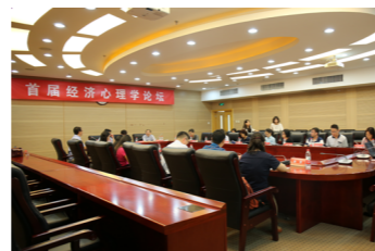
首届经济心理学论坛