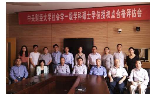
社会学一级学科硕士学位授权点合格评估会

心理学学硕旨在培养能够敏锐洞察和系统探究基础心理学与应用心理学领域前沿学术问题，并将心理学的知识与方法用于理解和解决广泛的经济与社会问题的高级专业人才。