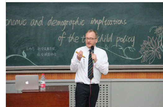
牛津大学 Stuart 教授讲座

学院通过“走出去，引进来”的方式大力开展国际交流与合作。十余年来，学院很多教师先后赴美国哈佛大学、斯坦福大学、芝加哥大学、杜克大学、卡内基梅隆大学、加州大学伯克利分校、加州大学戴维斯分校、密歇根大学、日本早稻田大学等世界著名大学访学交流，并与国（境）外研究者开展了研究合作与联合项目。同时，学院也邀请了哈佛大学、芝加哥大学、斯坦福大学、牛津大学、密歇根大学、普渡大学、纽约州立大学、加拿大温莎大学、澳大利亚墨尔本大学等国（境）外大学的知名教授短期讲学或举办讲座，并为本科生和研究生开设短期课程。