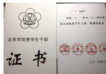
学生部分获奖证书

2004级、2008级、2011级、2012级和2013级应用心理团支部先后获得“北京市先锋杯优秀团支部”荣誉称号；2011级社会工作班、2012级应用心理班荣获“北京市先进班集体”称号；2011级、2012级和2013级本科生党支部先后荣获“北京高校红色1+1示范活动”一等奖、三等奖和二等奖。学院“读书会”被评为“北京高校学习型党组织建设品牌”。