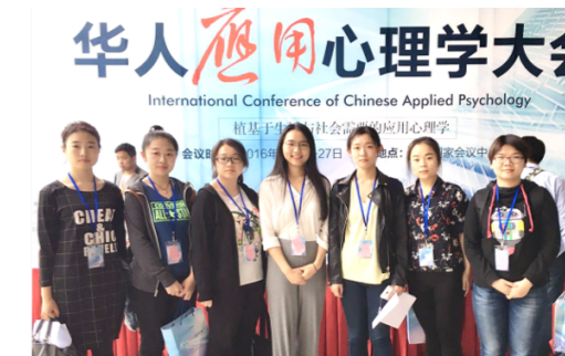
学院研究生参加华人应用心理学大会

社会工作专硕旨在培养系统掌握社会工作的理论、方法和技能，能够将社会工作理论与方法应用于金融服务、企业管理和政策评估等实务领域，拥有扎实财经素养和具备高度社会责任的高级社会工作专业人才。