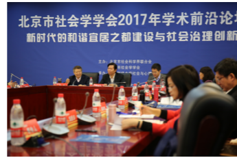
社会学学会学术前沿论坛

第六，在社会服务方面，与北京市社工委、国家开发银行以及大量企事业单位保持紧密合作，加强成果的社会应用；与校内各部门合作，2007年以来每年开展“金钥匙”全校学生思想与心理状况调查；与学校工会和教师发展中心开展了教师发展状况调查与服务；同时，还与经济学院、会计学院、金融学院保持了紧密的跨学科合作。