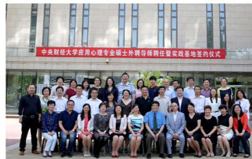
中财应用心理专业硕士外聘导师聘任暨实践基地签约仪式

应用心理专硕旨在培养掌握扎实的心理学基础理论和系统的专业知识，能够将心理学理论、方法和技术应用于经济、社会、健康、管理等领域以解决实际问题，富有财经优势的高级应用心理专业人才。